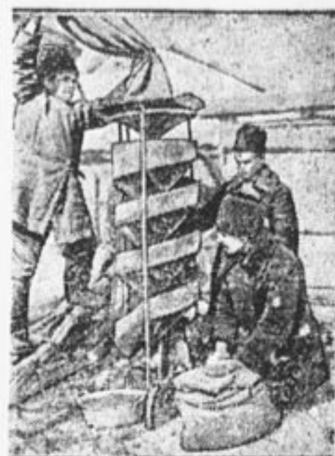
Сортировка семян машиной «Змейка» селькостропом села Марфино, Моск. губ.