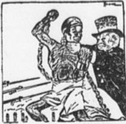
«Забота» Англии об Индии.

В Дели (столица Индии) в зал, где заседало англо-индийское правительство, были кем-то бро-