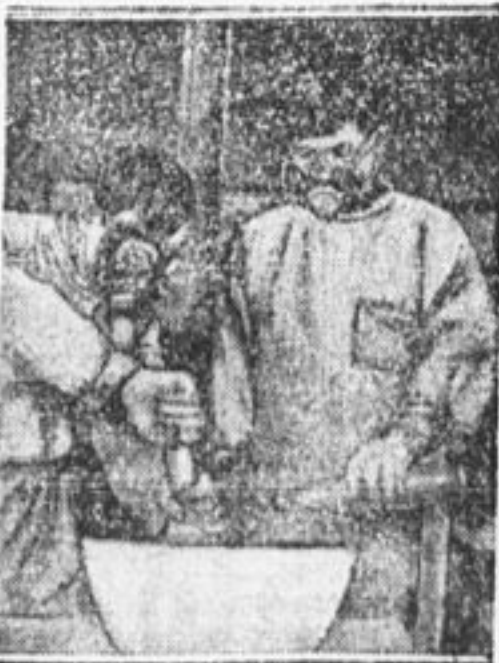
Изготовление ядовитой приманки для уничтожения амбарных и продуктовых вредителей: крыс и мышей, в лаборатории при МОЗО.