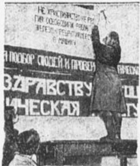
Организаторы антирелигиозного кружка в Кыштымской школе 2 ступ., на Урале.