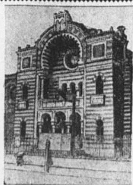
Минская синагога, превращенная теперь в клуб.